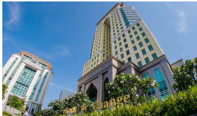
Figure 1: Descriptive phrase that serves as title and description. Reprinted [or adapted] from “Title of Article,” by Author First Initial. Second Initial. Surname, Year, Journal Title , Volume(issue), page number. Copyright [Year] by the Name of Copyright Holder.

NIDA Case Research Journal proudly invites scholars, experts and practitioners to send their case studies to advance the classroom learning experience of graduate students pursuing in various fields of development administration, including Public Administration, Economics, Business Administration, Social Development, Environmental Management, Law, Legal Studies, Human Resource Development, Language and Communication, Applied Statistics, Decision Technology, Actuarial Science and Risk Management, Population and Development, Information System Management and Computer Science, Tourism Management, Sustainability, Corporate Social Responsibility and Ethics, and Communication Arts and Innovation.