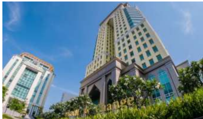
Figure 1: Descriptive phrase that serves as title and description. Reprinted [or adapted] from “Title of Article,” by Author First Initial. Second Initial. Surname, Year, Journal Title , Volume(issue), page number. Copyright [Year] by the Name of Copyright Holder.

NIDA Case Research Journal proudly invites scholars, experts and practitioners to send their case studies to advance the classroom learning experience of graduate students pursuing in various fields of development administration, including Public Administration, Economics, Business Administration, Social Development, Environmental Management, Law, Legal Studies, Human Resource Development, Language and Communication, Applied Statistics, Decision Technology, Actuarial Science and Risk Management, Population and Development, Information System Management and Computer Science, Tourism Management, Sustainability, Corporate Social Responsibility and Ethics, and Communication Arts and Innovation.